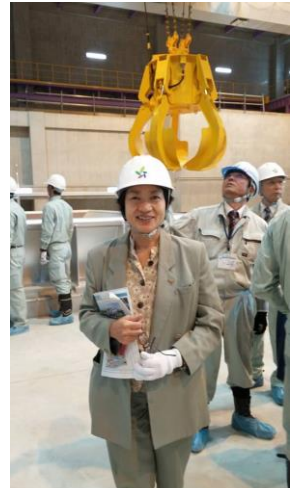
11月4日 月の浦の南部清掃工場と、乙金の最終処分場の視察。12月から試運転が始まります。