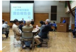
11月9～24日（南～北コミ）大野城市議会報告会