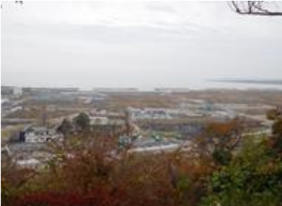
11月17～19日。宮城県石巻市・福島県視察研修。被災地の復興は厳しいです。原発被害の南相馬市の議長は苦渋の思いを語られた（石巻市日吉神社から）