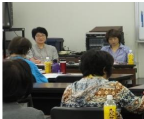
11月6～8日 沖縄にて全国シェルターシンポジウム。性暴力禁止法を求め痛切な討論。移住女性支援の分科会コーディネーター担当。辺野古ゲート前行動にも参加。「沖縄の囃」がある佐喜真美術館見学（普天間基地横）。