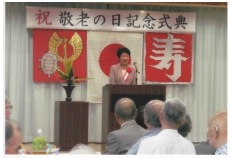
9月17日南ヶ丘1区敬老の集いにてご挨拶。1区では705人の方が77歳以上になりました