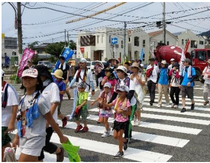
7月29日「非核・平和行進」。子どもたちと大野城市役所から筑紫野市まで歩きました