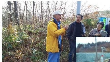
村中、フレコンバッグだらけです↓

本年5月3日は、日本国憲法施行70年です。改めて憲法を学び直し、主権在民、基本的人権の尊重、平和主義の理想を次世代に手渡していくこと、日常に、市政に活かしていくことが使命と感じています。14条「法の下での平等」や、25条「健康で文化的な最低限度の生活を営む権利」、26条「等しく教育を受ける権利」などを中心に、地方自治の目的である「住民福祉の向上」にしっかりと取り組んでまいります。 本年もよろしくお願いいたします。