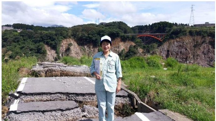
8月20日熊本市と益城町、9月27日益城町と南阿蘇村を視察。地震の被害は甚大で、官民あわせて被災者支援と復興に全力を尽くされています