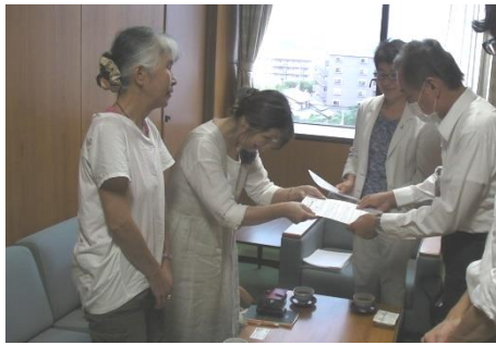
8月16日「玄海原発プルサーマルと全基を止める裁判の会」、市と議会への陳情に同席しました