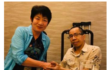
(松葉杖とバイクで活躍のドクさん)

立産婦人科病院です。1990年に開設された「平和村」には、今3~38歳の34人が暮らしています。(ドクさんは今平和村で働いています)。