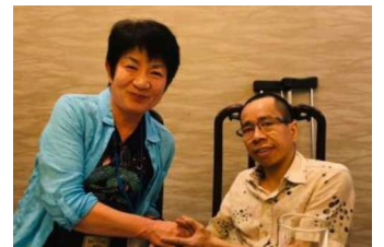
(松葉杖とバイクで活躍のドクさん)

立産婦人科病院です。1990年に開設された「平和村」には、今3~38歳の34人が暮らしています。(ドクさんは今平和村で働いています)。目や手足がない子、巨大な頭の子、多くは寝たきり。遊びが大好きで笑顔を返してくれる子たちも。